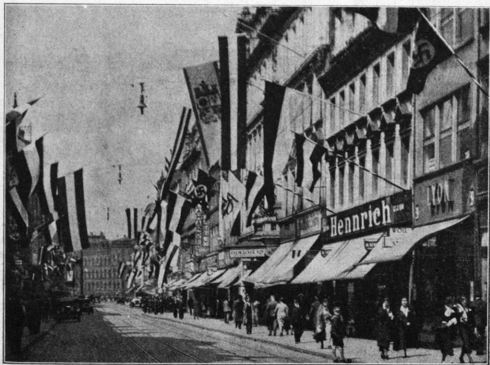
So feierte Saarbrücken den „Tag der deutschen Arbeit“ am 1. Mai 1933. Die Bahnhofstraße im Flaggenschmuck.

Auch der Feind wird unsere Liebe zur Heimat achten. Deutschland erwartet, daß jeder seine Pflicht tut! Ich möcht' erwachen im Sonnenschein und alles müßt' wie früher sein. Auch vom Saarland gilt's: „Up ewig ungedeelt!“ Deutsch im Herzen, tapfer, still, dann mag kommen, was da will. Die Sonne geht im Osten auf, im Westen geht sie unter! Kein Dräuen soll uns beugen den hochgemuten Sinn, Und jeder Tag soll zeugen, von welchem Stamm ich bin. Nacht muß es sein, wenn Saarlands Sterne leuchten. Seid uns treu wie wir euch. Germania, wahre dein Recht, wir sind dein Kind und niemand's Knecht. Im Osten dort, im Westen hier, furchtlos und treu, denn wir sind wir! Ich bin ein Deutscher, klingt's nicht voll und gut! Trotz Lardieus „gloire“ und „pouvoir“ deutsch bleibt die Saar! Getrennt, doch nicht geschieden. Nur nit brumme, 's wird scho kumme. Der alte Geist von 1815 stirbt bei uns nicht aus. Wer will uns hindern, deutsch zu denken und zu handeln. Wenn man uns auch die Kohle nimmt, das deutsche Feuer weiterglimmt. Wenn ich einmal der Herrgott wär, Mein erst wäre das: Was? Laß' se schaffe, laß' se raffe, Laß' se holle, was se wolle; Unser Herz, das krien se nit!