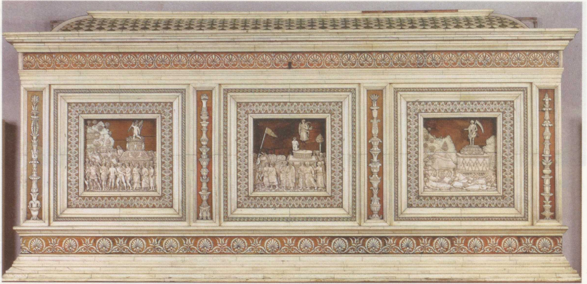
Abb. 6: Die Elfenbein-Brauttruhen der Paola Gonzaga mit Petrarca's Trionfi 1-3: Liebe, Keuschheit und Tod (1476/78;)