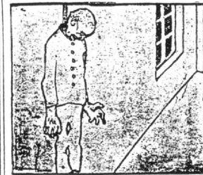
Bref, le sergent Külke fit tant que le jeune sol- dat se perdit...