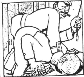
... Si, après ça, ton corps n'est pas habitué à la dure!