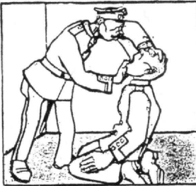
... puis à te mettre de l'eau dans la bouche pour te laver, salaud!