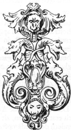
Fig. 85 Türklopfer von Bologna (Nohl.)

Von den ehernen (und vollends, bei Paul II., silbernen) Kühlvasen, Kohlenbecken u. dgl. Geräten, von welchen besonders Benvenuto Cellini spricht, ist nichts Erhebliches erhalten. – Wo die am schönsten verzierten Glocken und Kanonen sich befinden, ist dem Verfasser nicht bekannt.