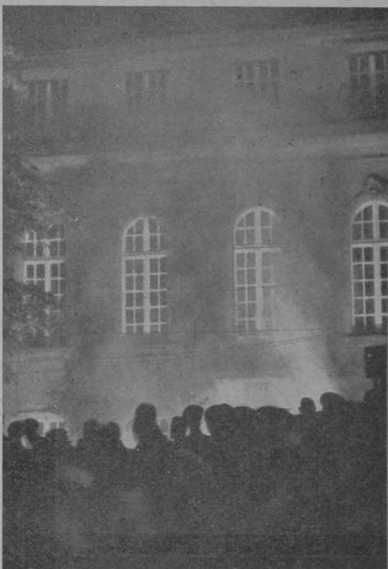
Schloßplatzspiele Saarbrücken Der Rebell von der Saar