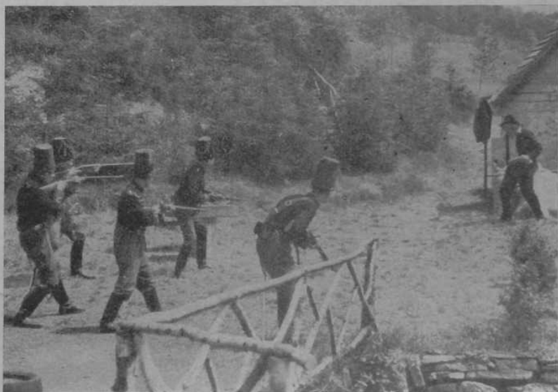
Freilichtspiele Gräfinthal Der Rebell von der Saar