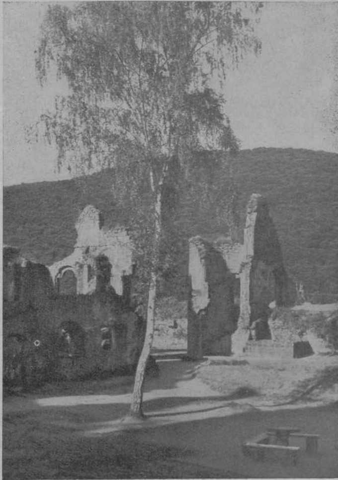
Freilichtbühne auf der Gardenburg bei Bad Dürkheim