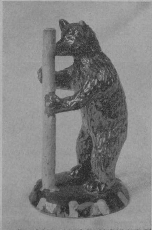
Der Tanzbär Arbeiten des Töpfers Theysohn-Pirmasens