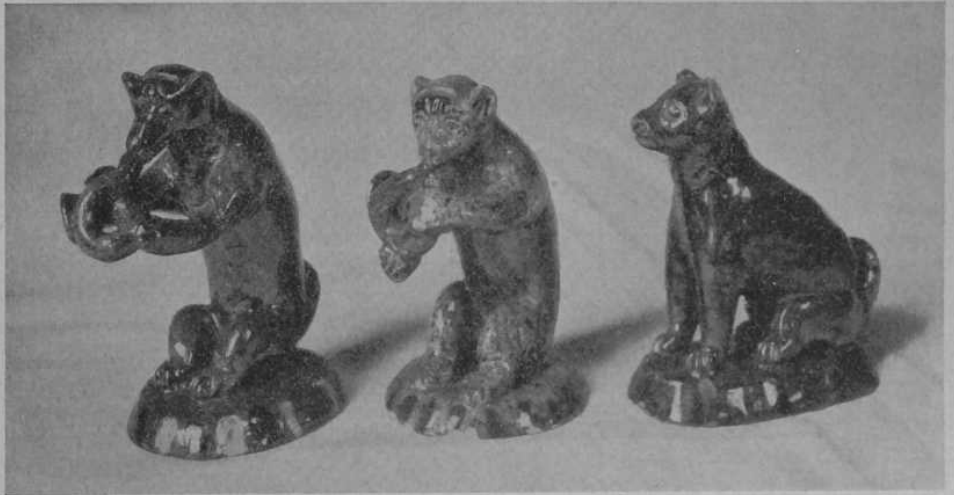
Spielende Affen und sitzender Hund Arbeiten des Töpfers Theysohn, Pirmasens