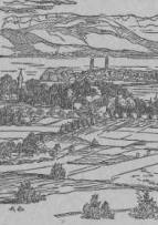
Landes, die nur durch Berlin mit dem Land verbunden... (Wie Bild 1. aus 'A. B. L. S.')