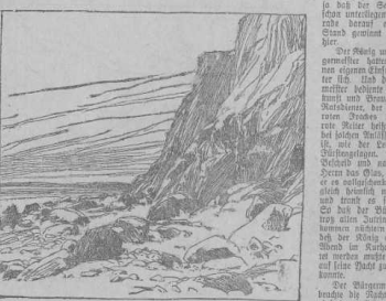
Oben: Die... Unten: Die... Burg der Lübecker...