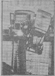
Nach dem Zusammenbau.

in der Lehr- und Forschungsanstalt für Garten- und Weinbau in Gelsenkirchen am Rhein. In der Anstalt werden die modernsten Einrichtungen für den Weinbau gezeigt.