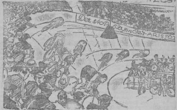
Scharfe Fahrt in der Karve.