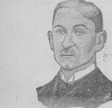
General von Nathusius.

Der Beginn des Jahres zeigt den Mainzer Domschiffbau in Bremerhaven in vollem Gange.