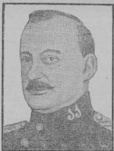
Primo de Rivera, der spanische Diktator.