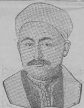
Abd-el-Reim, der Führer der Kiffkahlen.