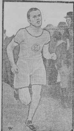
Der Führer der Berken.