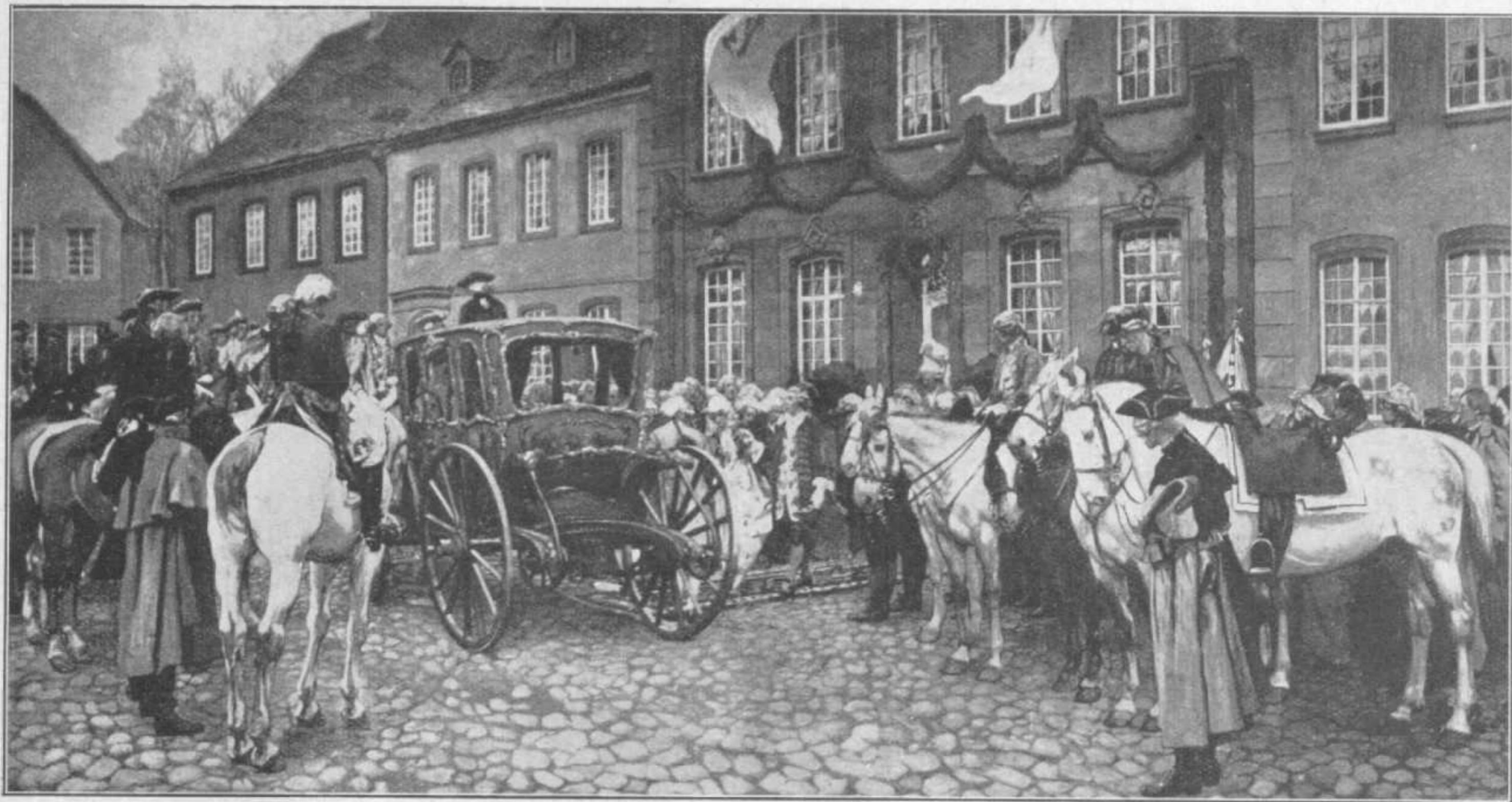
Hochzeit der Gänsegretel und des Fürsten Ludwig am 28. Februar 1787.

Aufnahme von Max Wenß. Ölgemälde im Kreishause zu Ottweiler.